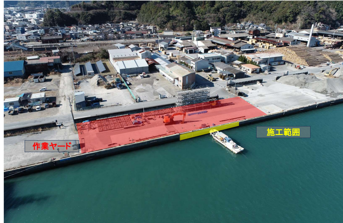
現場付近を上空から（1月末時点）